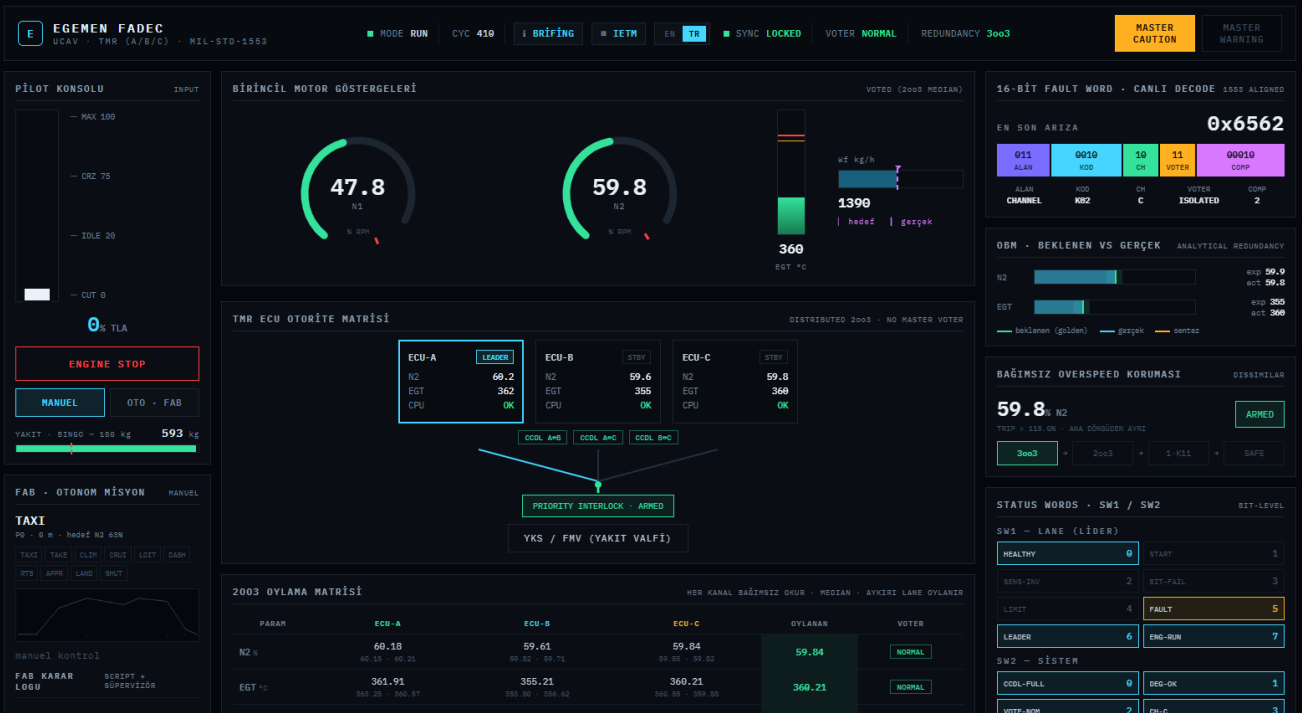
Şekil 2 - Manuel rölantri: N2 %60'ta tutuluyor, tüm kanallar sağlıklı, oylama NORMAL, OBM residual'ları sıfıra yapışık, yakıt 600 kg'da dolu.

Otonom uçuşta (v26) hedef N2 artık bacaklar arasında ışınlanmaz: sonlu bir kol hızıyla kayar — yukarı 7, aşağı 4, acilde 12 %N2/s — böylece kalkış 63'ten 100%'e yaklaşık 5,3 sn'de tırmanır ve shutdown gerçekçi bir throttle-chop olur. İrtifa da atlamak yerine 350 m/s ile rampalar. Devreye giriş bumpless'tir: kol o anki konumdan yürümeye başlar. Süpervizörün kararları gerektiği yerde anlık kalır (ACİL); yalnız fiziksel uygulandığı hız-sınırlıdır.